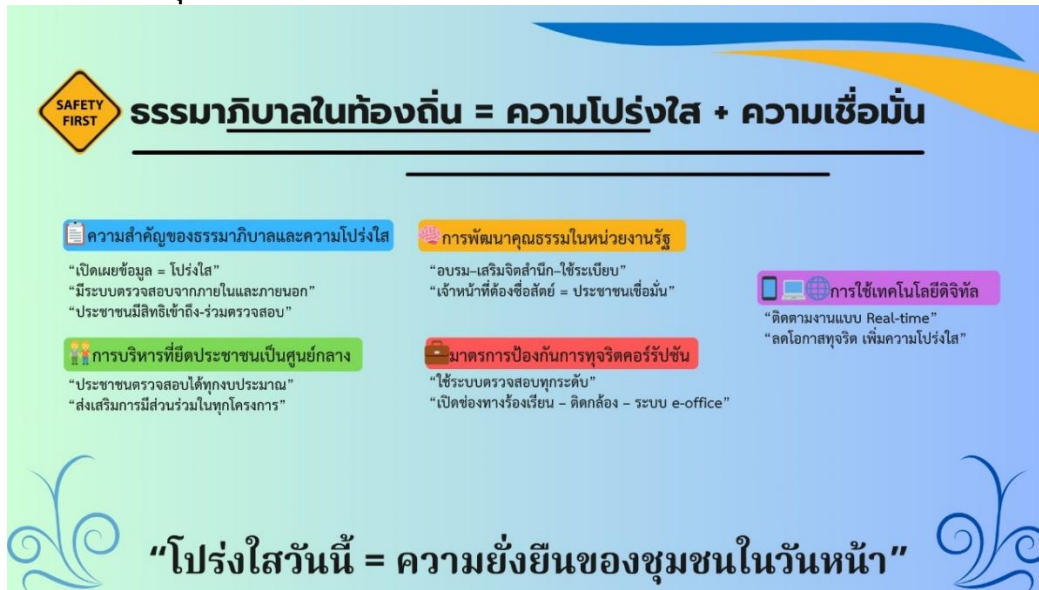
ภาพที่ 2 กลไกเสริมสร้างความโปร่งใสในหน่วยงานปกครองส่วนท้องถิ่น