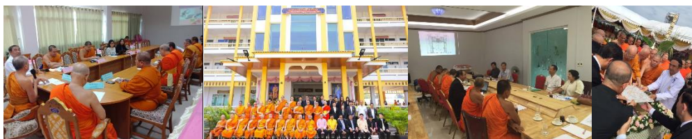
ภาพที่ 1 ในฐานะผู้ประสานงาน ขับเคลื่อนร่วมกับคณะสงฆ์ในเขตพื้นที่ และมหาวิทยาลัยส่วนกลาง ให้เกิดการจัดตั้งวิทยาลัยสงฆ์เพื่อการพัฒนาทรัพยากรมนุษย์ในพระพุทธศาสนาที่เพชรบุรี และราชบุรี (ภาพผู้เขียน 16 มกราคม 2562)