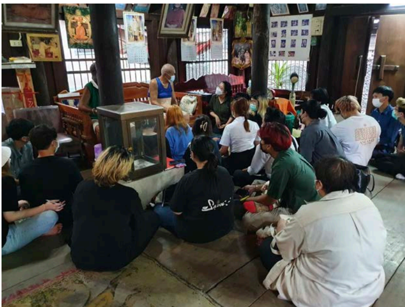
ภาพที่ 2 การลงพื้นที่ย่านบางยี่ขันร่วมกันของนักศึกษาสำนักวิชาดุริยางคศาสตร์ สถาบันดนตรีกัลยาณี วัฒนา และนักศึกษสาขาวิชาประวัติศาสตร์ท้องถิ่น คณะโบราณคดี มหาวิทยาลัยศิลปากร (2565)

วิธีวิทยาสำคัญที่ช่วยในการทำความเข้าใจชุมชน คือ การลงพื้นที่ สัมภาษณ์ ชุมชน สัมภาษณ์ ผู้คนในชุมชน และทำความเข้าใจบริบทต่างๆ ก่อนที่จะนำมาสู่การตีความ และสร้างสรรค์ผลงานจากภาคสนาม อย่างไรก็ตาม จากข้อคิดเห็นและวิพากษ์จากผู้ทรงคุณวุฒินั้นยังไม่เห็นถึงกระบวนการทำงานสร้างสรรค์จากการบูรณาการระหว่างสาขาวิชาประวัติศาสตร์ท้องถิ่นและสาขาดุริยางคศาสตร์อย่างชัดเจน รวมทั้งการทำงานร่วมกับเยาวชน ทั้งนี้ผู้วิจัยต้องกลับมาทบทวนตัวเองอีกครั้งจากกระบวนการทำงานข้ามศาสตร์นั้นว่ากระบวนการหรือวิธีการระหว่างประวัติศาสตร์ท้องถิ่นกับมานุษยวิทยาดนตรีประยุกต์ โดยเฉพาะการเข้าถึงข้อมูล และการให้ความสำคัญกับ “เสียง” จากพื้นที่ศึกษาควรร่วมเรียนรู้ แลกเปลี่ยนการทำงานบนโจทย์ร่วมมากกว่านี้ อีกทั้งยังต้องให้ความสำคัญกับกระบวนการมีส่วนร่วมของชุมชนที่มากขึ้นมากกว่าการร่วมแสดง ดังนั้นกระบวนการทำงานควรเป็นการทำงานที่บูรณาการร่วมกันตั้งแต่การเก็บข้อมูลจนนำไปสู่การสร้างสรรค์ผลงาน บทสังเคราะห์และสรุปผล